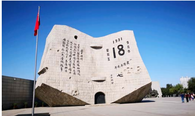
“九一八”历史博物馆“残历碑”。(资料片)

战争的硝烟早已消散，如今的东北正争分夺秒加速前行。永不止息的奋进背后，是永志不忘的记忆——沈阳“九一八”历史博物馆残历碑上，残缺的日历上以苍劲文字记载着一段惨痛历史。真相时刻提醒人们：震惊中外的九一八事变是中国人民抗日战争的起点，标志着世界反法西斯战争的开始；而在艰辛抗战历程中形成的伟大精神，可歌可泣、历久弥新。