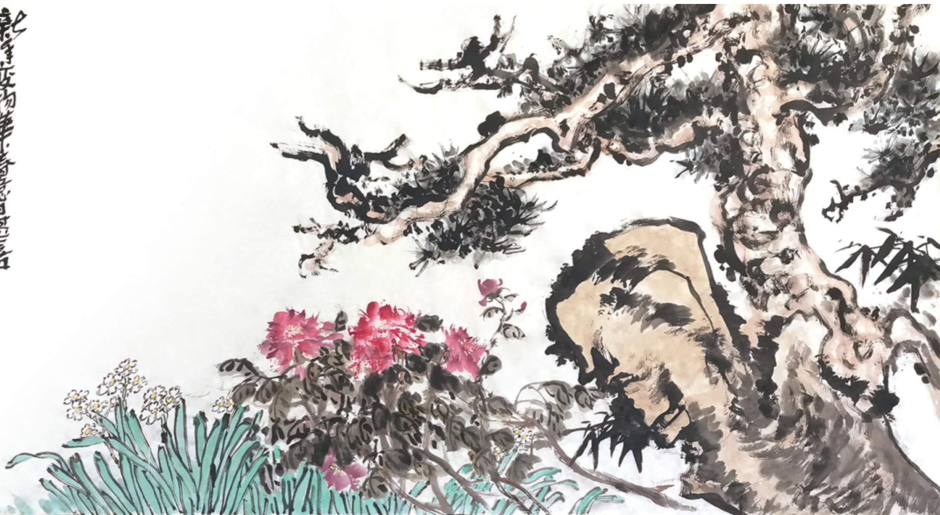
《新年变物华 春意日堪嘉》 张宜、魏百勇、李岩、刘仲原 248cm×129cm

春信已至，寒意未消。唐代诗人郑谷曾言：“江国正寒春信稳”，而宋代诗人陆游也吟唱过“春信今年早”。每一个热爱生命、热爱生活的人，都能敏感地捕捉到春天即将来临的气息。岁岁年年，每一个春天都值得我们期盼、欢欣。《大众书画》“约绘”栏目特别策划推出三期“迎春”活动，其中本期为“春信”篇。