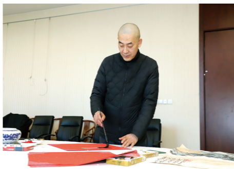
张宜，中国美术家协会理事、山东省美术家协会常务副主席、秘书长，山东省青年美术家协会名誉主席，山东艺术学院兼职硕士研究生导师，山东大学艺术学院外聘硕士研究生导师，山东师范大学美术学院外聘硕士研究生导师，曲阜师范大学美术学院外聘硕士研究生导师。