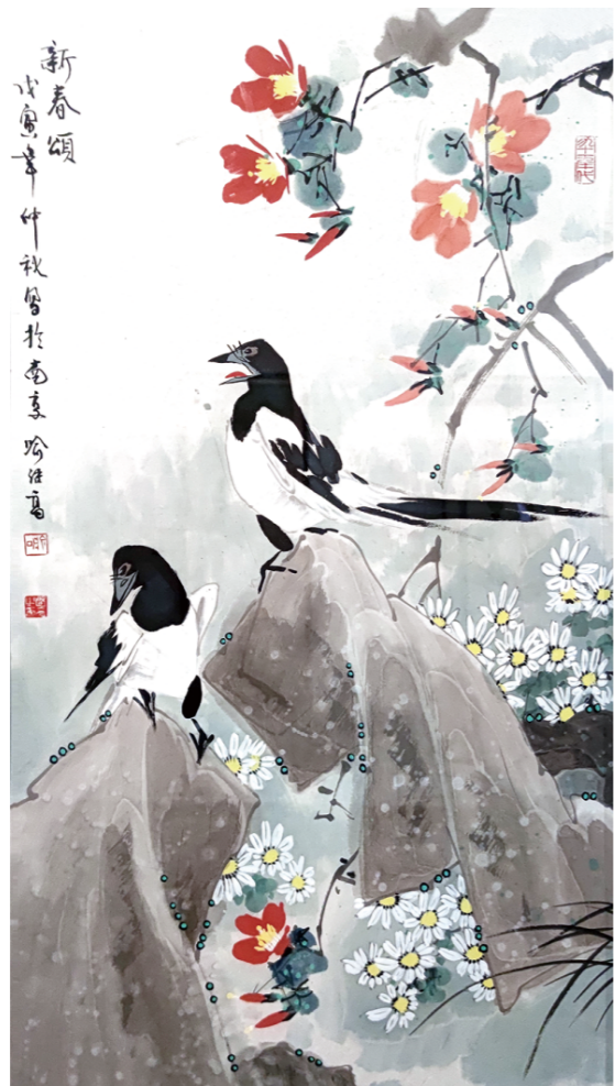
《新春颂》 喻继高 48cm×90cm

《大众日报》走过了85年长路，回首山海广阔，足迹坚实。展卷岁华又一新，新闻人与书画家将继续携手同行，愿我们以丘壑万仞的襟怀，彼此给予繁花似锦的关爱，共赴星辰大海。