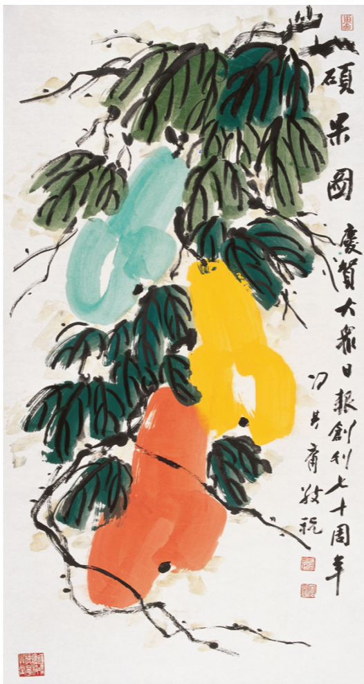
《硕果图》 冯其庸 69cm×136cm