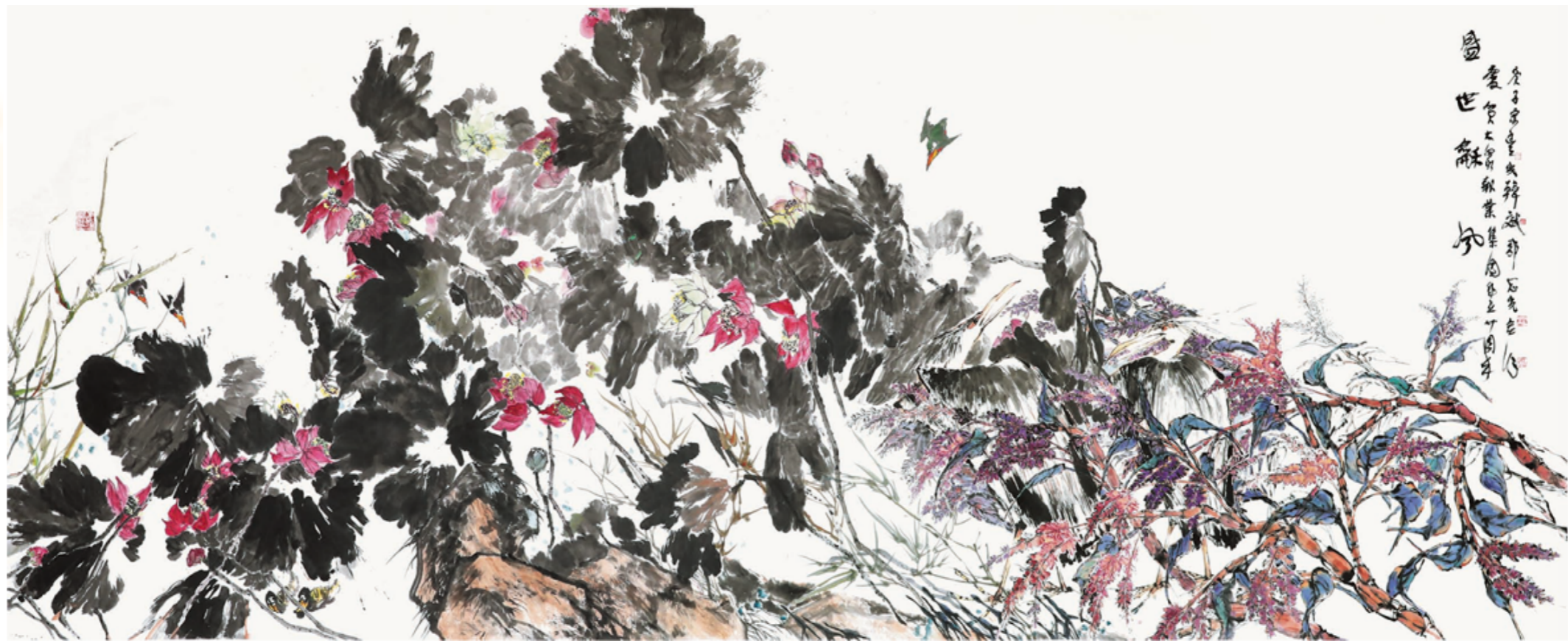
《盛世和风》 郭志光 宋丰光 韩斌 600cm×240cm

展览时间：2023年12月26日至2024年1月15日 节假日及周末闭馆 展览地点：山东新闻美术馆