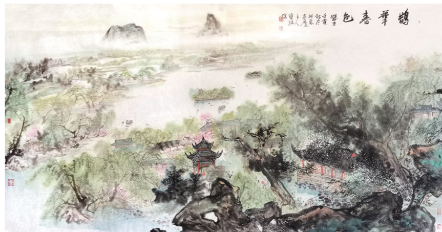
《鹤华春色》 张宝珠 180cm×97cm