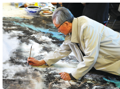
丁宁原，1939年生，山东青州人。山东师范大学教授，山东画院顾问，山东省美协顾问。