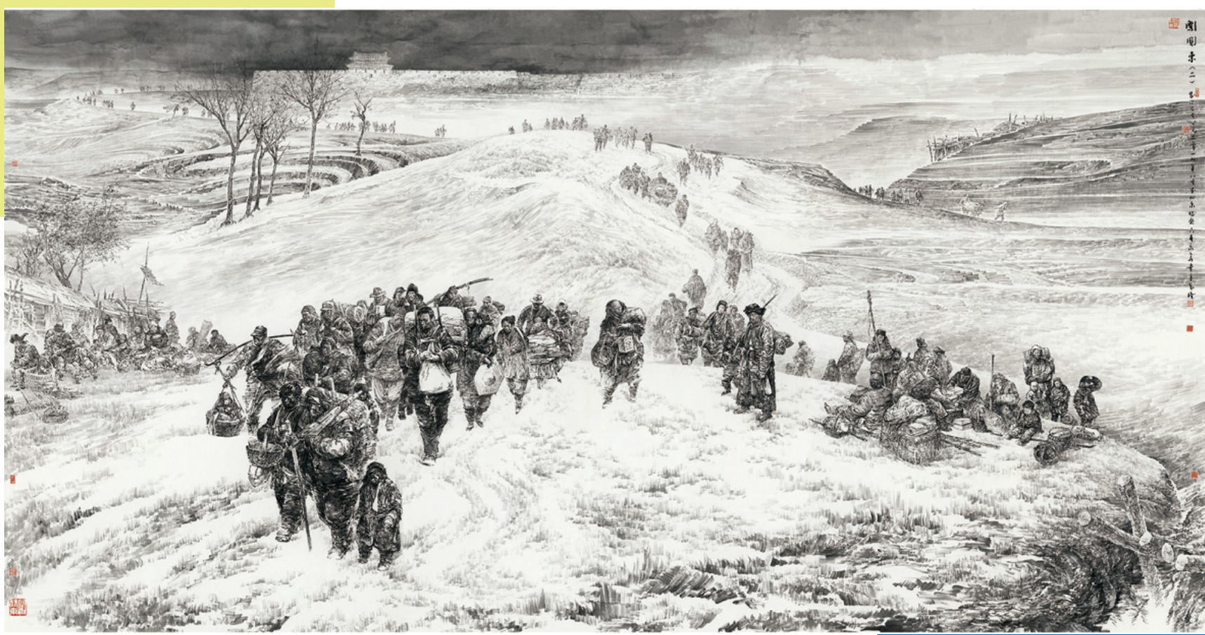
《艰涉·闯关东 II》 558cm×282cm