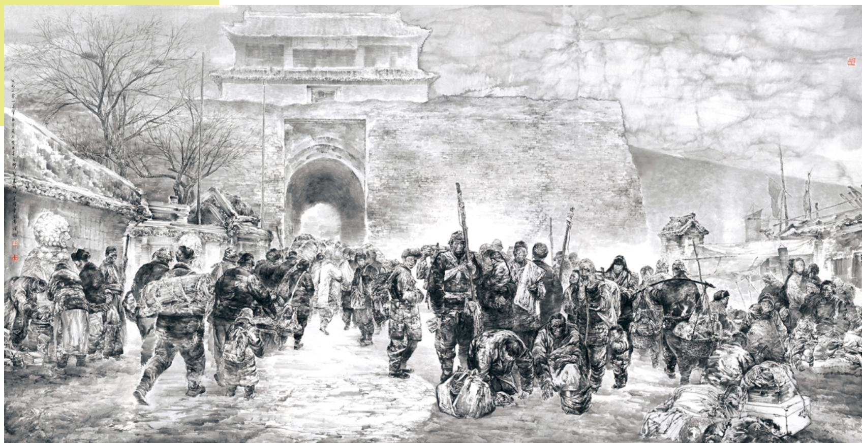
《去乡·闯关东 I》 585cm×295cm