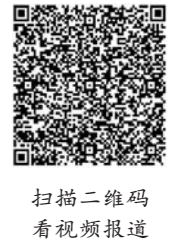
扫描二维码 看视频报道