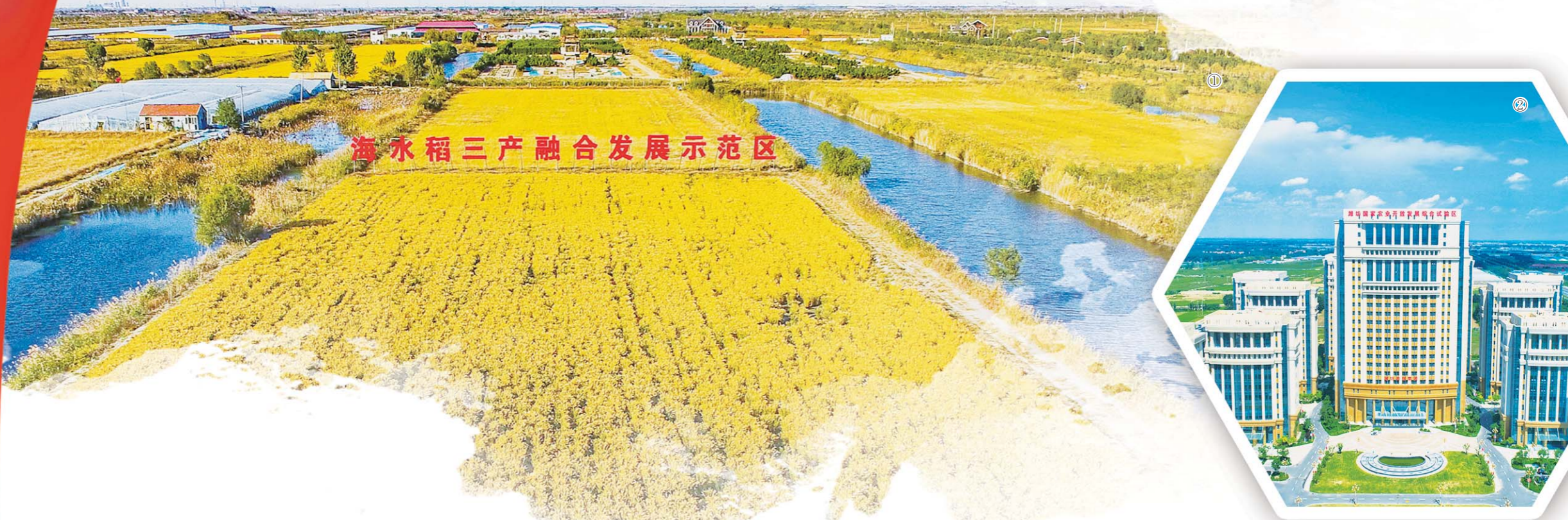
海水稻三产融合发展示范区