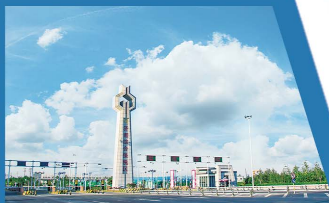
济南综合保税区项目