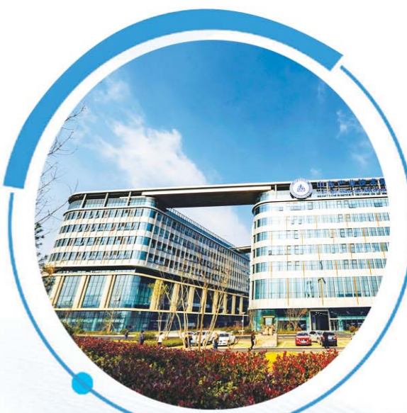
山东产业技术研究院项目