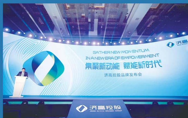
2018年11月8日济高控股集团品牌发布会