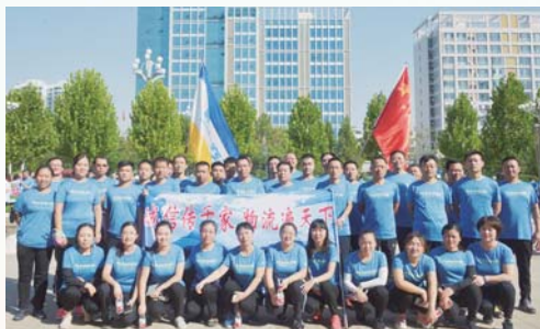
△聊城交运集团千千佳物流有限责任公司工会委员会

公司工会严格落实基层工会阵地“六有”标准，紧紧围绕公司发展战略和目标需求，确定对“职工之家”提档升级改造。2019年投资100余万元，整合二楼500平方米的办公场所，建成集职