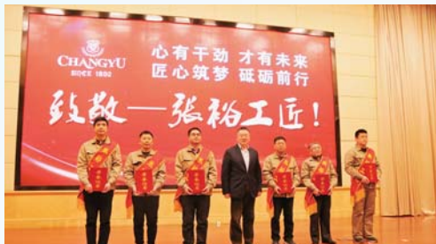
△烟台张裕集团有限公司工会委员会

为职工搭建健身强体平台，工会每年按照每名职工300元的标准划拨活动经费，用于各单位开展积极向上的文体活动。以社会主义核心价值观陶铸职工情操，激发职工工作热情，以良好的精神状态投入到工作中去，切实增强职工的凝聚力和战斗力。2019年，在工业园区投资300万元打造一处建筑面积约1000平方米的“职工之家”，规划健身、减压、学习、爱心4