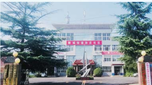
△肥城市新城街道孙庄社区工会联合会

不仅如此，社区工会拓展线上阵地，以网络建设为支撑打造线上“智慧工会”，用云数据为职工提供更加精准的服务。通过交友圈、婚恋交友、工会矩阵、心理咨询、在线维权、积分商城等服务，为职工群众提供