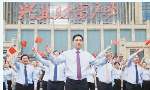
△日照兴业集团有限公司工会委员会

全、送清凉、送关爱”活动同时，发挥“兴业前置互助基金”作用，累计帮扶困难职工家庭48个，发放职工互助资金95万元。