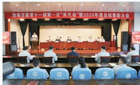
△滨州渤海活塞有限公司工会委员会

为加强对厂务公开工作的领导，公司党政领导班子坚持把厂务公开作为加强企业民主管理制度建设，促进企业改革发展稳定的大事来