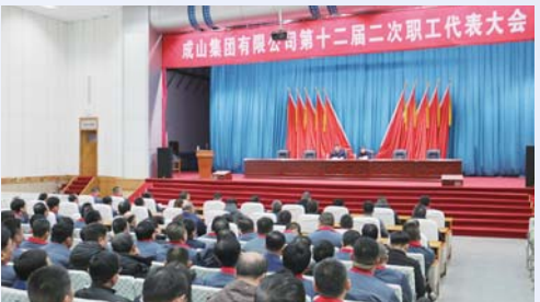
△成山集团有限公司工会委员会

鼓励职工敢于创新，将职工的创新成果转化成为生产力，公司工会积极开展合理化建议、技术创新活动。2019年，共采纳立项创新建议66条，实施奖励41200元；采纳合理化建议共28条，确认硬收益494万元，实施奖励111万元。