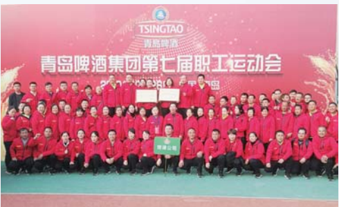
△青岛啤酒(菏泽)有限公司工会委员会

通过“员工技能大赛”“岗位大练兵”，实施薪酬体制改革，以业绩为导向，打开人才成长晋升管理通道，提升职工幸福指数，做优职工“爱家”。