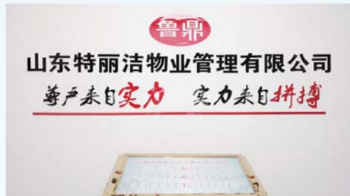
△山东特丽洁物业管理有限公司工会委员会

此外，公司工会组织全体职工深入开展“当好主力军、建功新物业”劳动竞赛，建立健全劳