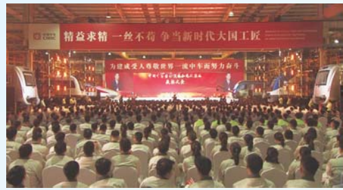
△中国铁路工会中车青岛四方机车车辆股份有限公司委员会

扶服务，仅2020年，就发放价值42万元慰问品、慰问金292万余元。办理青岛市职工医疗互助保障计划A方案724人次，合计理赔81.82万元。