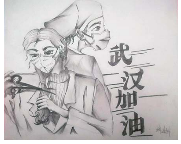
荣成十二中 初四二班席进科同学作品。