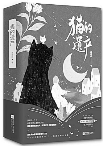
《猫的遗产》 画眉郎 著 江苏凤凰文艺出版社

在欧洲中世纪，英法百年战争是一部激烈、漫长而且曲折离奇的历史。两国在这场旷日持久的战争中塑造了自己的国家和民族的身份。该书以宏大的视角、丰富的细节为世人展示了这场人类历史上的重大事件。