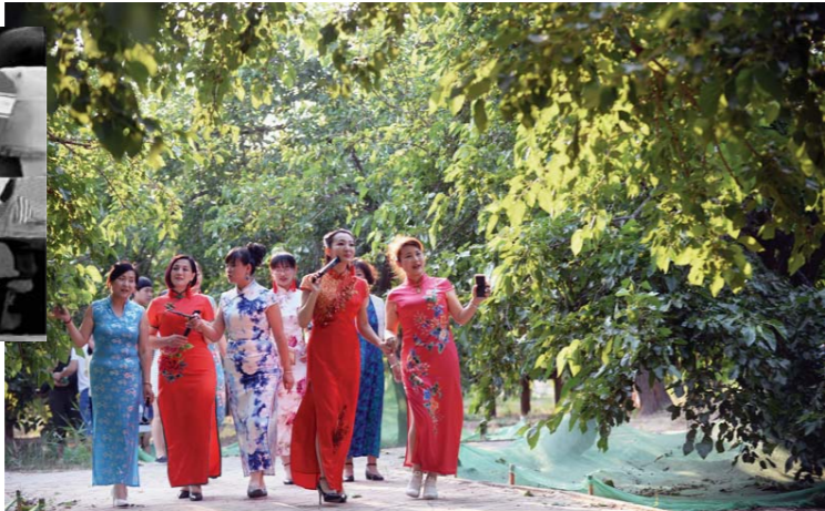
春日，阳信县喜爱旗袍的女士走出家门，尽显自己的美丽身姿，她们在追求美的道路上早已没有了任何思想障碍。