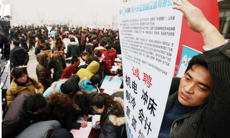
如今的人才招聘会上，技术人员奇缺，求贤若渴的厂家招聘人员高举招聘广告，广纳技术人才。