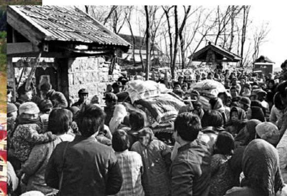
1986年，费县岩坡乡富贵庄村的迎亲场面。当年的富贵村很穷，自然条件也差，但村里已种上了200亩山楂树，还饲养了500只长毛兔，开始走上致富之路。