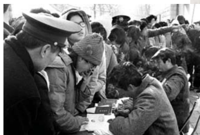
1987年12月6日，济南市职业介绍市场开张第一天，出乎组织者的意料，一些地处偏僻甚至是集体企业竟成了应聘的热点。