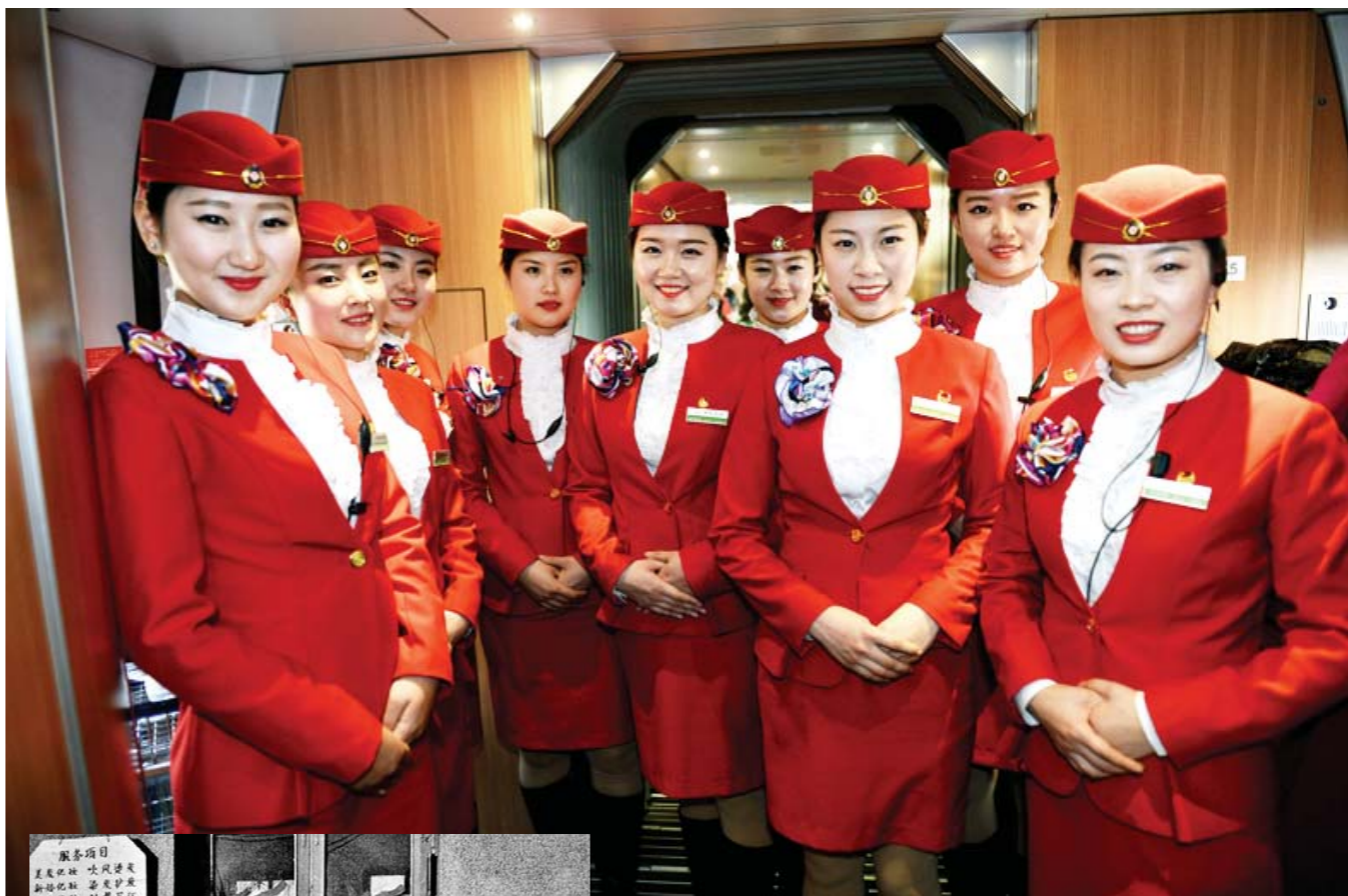
2014年，青荣高速铁路开通首日，经过层层选拔，即将上岗的列车乘务员青春靓丽，姑娘们喜悦而自信的气息扑面而来。