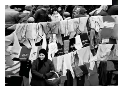
1981年，钱捍拍摄的《没赶上好时候》。蒙阴农村大集上，一位农村老人身上的传统棉服与摊位上样式新颖的时装形成鲜明对比。