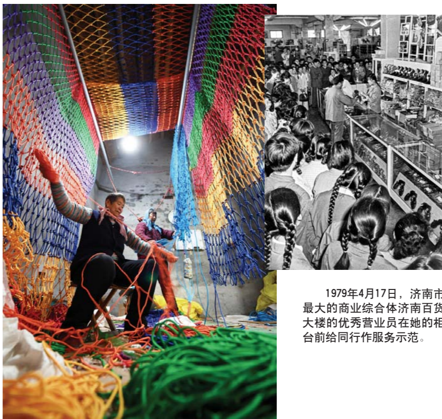
1979年4月17日，济南市最大的商业综合体济南百货大楼的优秀营业员在她的柜台前给同行作服务示范。