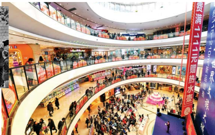
2018年，货源丰富、宽敞明亮的济南室内购物街，来来往往的顾客不仅在这里可以购买中意的商品，还能享受各种娱乐和美食。