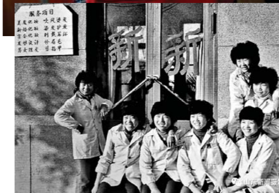
1984年，7名来自山区的农家姑娘在沂南县城创办了新新美容理发店，专为爱美、敢于追求美的女士美容美发。