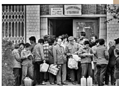
凭票供应粮油的年代。1981年4月20日，市民在济南市经十路东首粮油食品店手持粮油票证等待购买当月凭票供应的粮油。

习近平总书记视察山东时，要求山东在全面建成小康社会进程中走在前列，在社会主义现代化建设新征程中走在前列，全面开创新时代现代化强省建设新局面。这是党中央、习近平总书记对山东经济社会发展的高度重视和殷切期望，明确了新时代山东发展的目标定位，为下一阶段山东经济社会发展指明了前行的方向和路径。随着改革开放的不断深入，中国经济进入飞速发展新时代，怎样才能走在发展的前列？创新、改革、开放是必由之路。