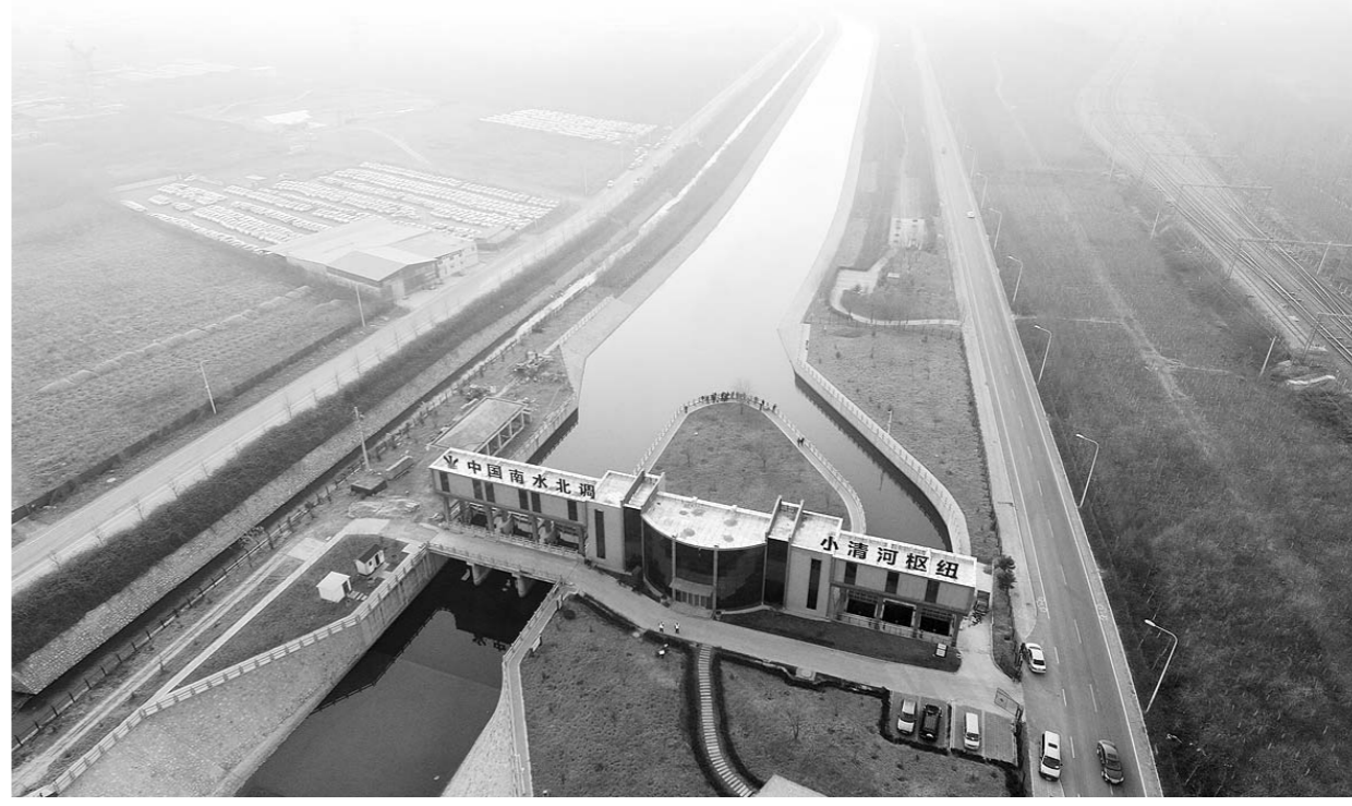
位于济南的南水北调小清河枢纽。

以前一遇到旱情持续,南四湖、东平湖“水干得像酱油”。现在,借助南水北调工程引江、引黄,山东已有能力有手段缓解此类危机。还有胶东地区降水一偏少,青岛、烟台、威