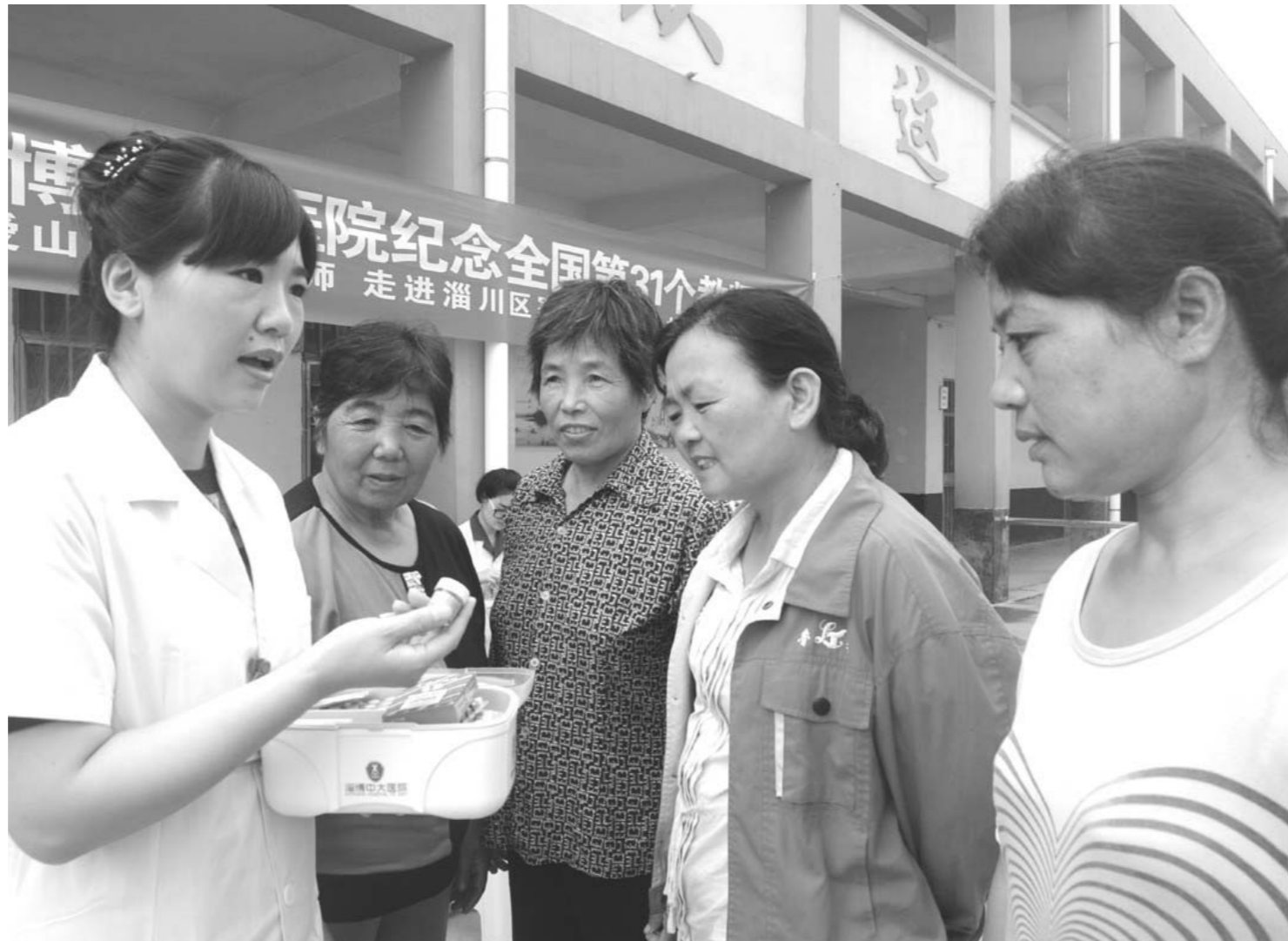
□闫盛霆 王凯 报道

□黄敬汉 杨润勤 报道 本报高密讯 近日，高密市人民医院将婴儿暖箱、辐射保温台、电动妇科综合手术床、精皮胆红素仪、听力筛查仪、多参数心电图监护仪等价值12.897万元的医疗设备赠送给该市大牟家镇中心卫生院。目前，这批医疗设备已全部安装到位并投入使用。