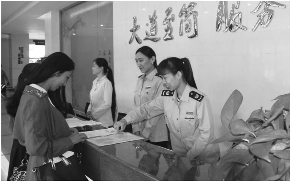
肥城市政务服务中心窗口工作人员向群众讲解办理流程。

肥城进一步推进预审并联,充分发挥政务服务中心平台集聚优势,深入分析研究审批事项之间的内在关联性,实现1+1>2的效果。