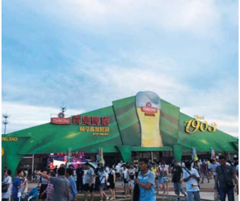
△青岛啤酒节上欢乐的中外游客