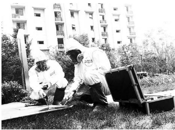
18日中午，雨停之后，防化部队对积水进行检测。