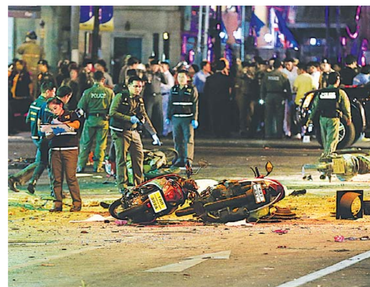
首都曼谷市中心，摩托车倒放在爆炸现场。