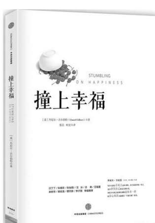
《撞上幸福》 [美]丹尼尔·吉尔伯特 著 中信出版社

鲍勃·迪伦被认为是20世纪美国最有影响力的民谣、摇滚歌手，并被视为20世纪60年代美国民权运动的代言人。他直接影响了大批同时代和后来的音乐人。本书从另一个角度剖析鲍勃·迪伦的真实生活和内心，让你重新认识一个“全新”的鲍勃·迪伦。