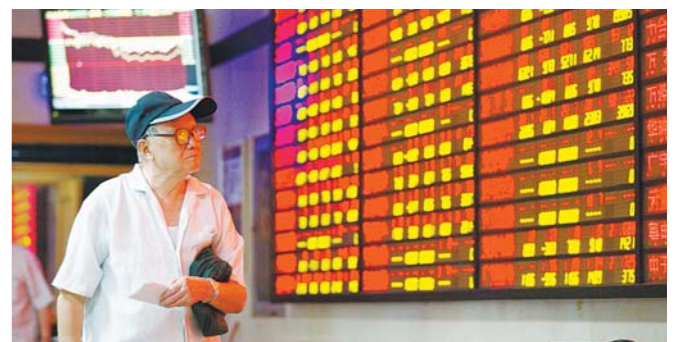
股民在证券营业厅关注股市行情。