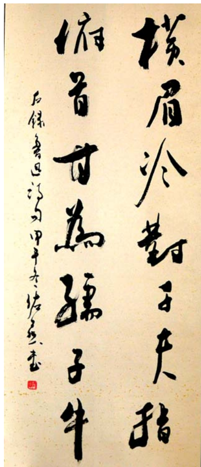
横眉冷对千夫指 俯首甘为孺子牛