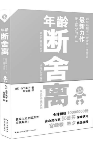
《年龄断舍离》 [日] 山下英子 著 长江文艺出版社

作者重读了19世纪著名女作家的作品，将19世纪的英美女性文学视为一个整体进行了综合研究。以其激进的批评姿态和对19世纪英美女性文学的全新阐释，对西方文学与文化研究产生了深远的影响。