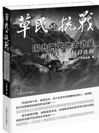
《草民的抗战》 谢维衡 著 中国文史出版社

这是一部以抗日战争时期胶东地区真实历史资料撰写的40余万字的长篇纪实文学。真实展现了胶东地区两党地方武装合作抗战的原貌，读后对那场全民族共同参与的卫国战争有了新的认识。