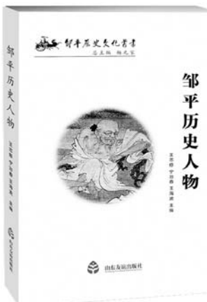
《邹平历史人物》 山东友谊出版社

2015年是中国社会再次经历的一个重大的历史转折时期。吴敬琏、厉以宁等学者、企业家，从各自所从事的领域出发，给出了极具建设性的观点，为我们抢占新时期的制高点提供了宝贵助力。