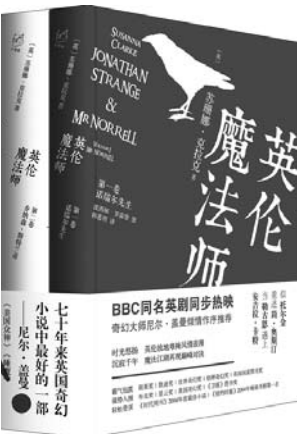
《英伦魔法师》 [英] 苏珊娜·克拉克 著 湖南文艺出版社

本书选取历史上邹平地域内政治、军事、文化、经济、社会等各个方面有过一定影响或重要贡献的历史人物115个，所有人物事迹，皆以史实为据，不虚构杜撰，行文平实，结构严谨，对研究邹平历史有一定的参考价值 and 资料价值。