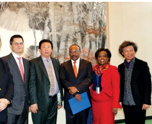
王林旭(左三)在联合国“中国厅”启动暨王林旭画作揭幕仪式上。

王林旭 1959年出生于山东平度，中央民族学院研究生毕业。中央民族大学副校长、国家民族画院院长，国家一级美术师，全国政协常委，全国政协书画室成员，美国加州圣荷西州立大学人文学博士，中国美术家协会会员，中国书法家协会会员，国家有突出贡献文化艺术专家，享受国务院政府特殊津贴，2008年北京奥运会视觉艺术顾问，联合国世界艺术家联盟组织主席。