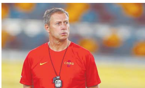
1月8日，在澳大利亚布里斯班昆士兰体育中心，中国队主教练佩兰在观察队员训练。