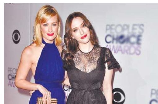
情景喜剧《破产姐妹》两名女主角凯特·戴琳斯（右）和贝丝·比厄现身第41届美国人民选择奖颁奖典礼