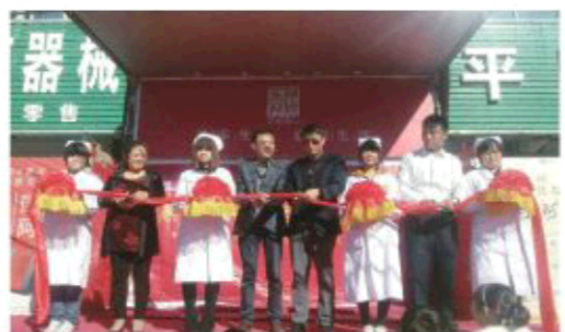
△济南北方平民大药房膏方节启动

于敏教授说，冬季寒当令，寒邪作为一种致病因素有两个突出的特性。一是“寒为阴邪，易伤阳气”，二是“寒主收，引凝滞”，所以冬天的时候容易怕冷，容易感冒，手脚冰凉，这都是寒邪致病的表现。冬令进补，实际上是为了增强人的抵抗力，起到正气存内、邪不可干的作用。中医在养生保健方面非常强调冬季进补和阴精的作用，《黄帝内经》有一句话“阴精所奉其人寿”，就是说如