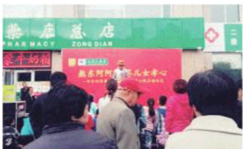
△聊城利民东阿阿胶活动现场

一方水脉，一方乾坤。阿胶是在齐鲁文化影响下，古代先人的智慧创造，是与人参、鹿茸齐名的“中药三宝”。东阿出阿胶，东阿之外，严格说只有驴胶，非阿胶。这犹如长白山人参，西藏冬虫夏草、霍山石斛一样，地域性决定了原产品的道地和不可复制。弘景曰：