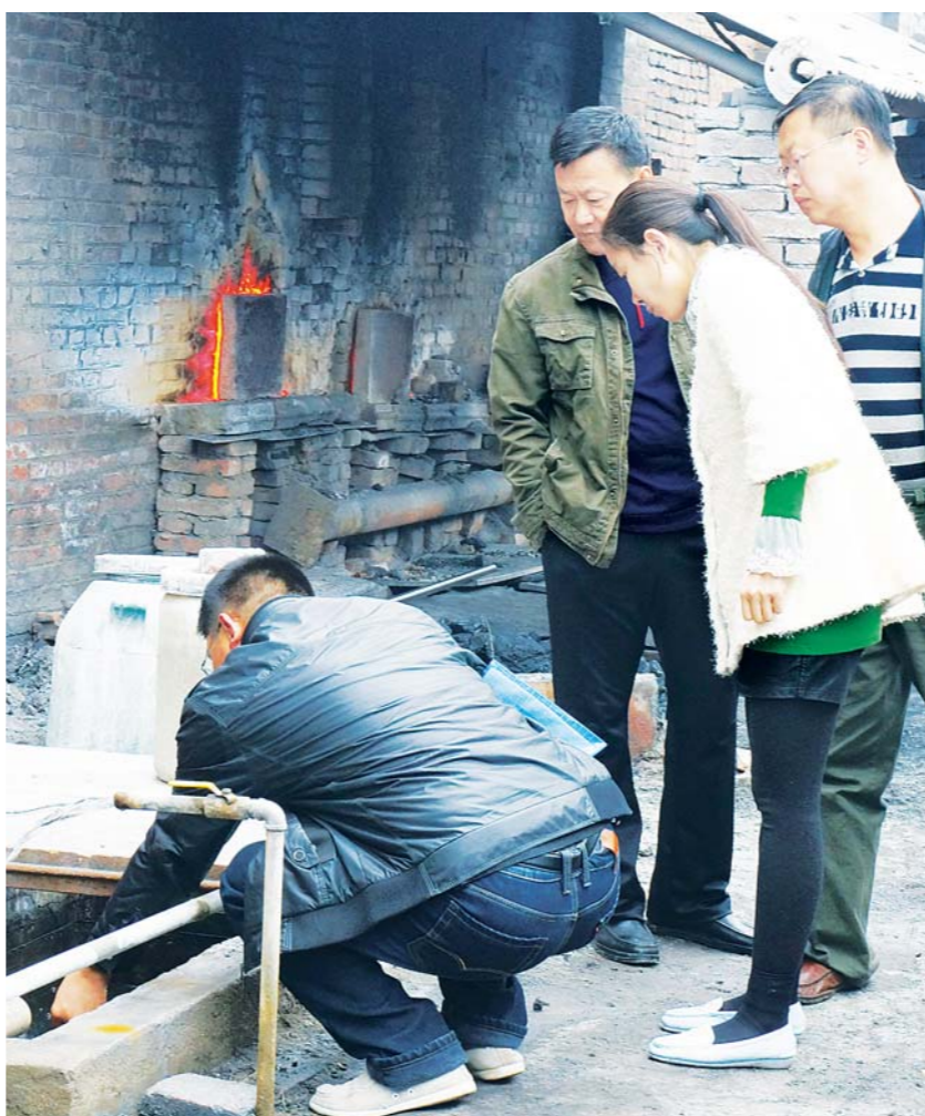
两地环保部门工作人员便装取缔一处跨界污染土小企业。