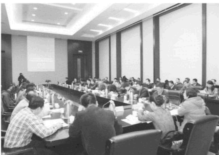
△12月11日至12日,全国市场监管工作研讨会暨网络市场监管现场经验交流会在淄博召开。

省工商局与公安、食药监等部门联合建立了保护知识产权规范网上经营协作机制,机制建立以来收效明显,已删除网上侵犯我“东阿阿胶”等企业知识产权的信息5000多条。制定下发了网监工作规范,推动了全省网监工作规范开展。在全省建立了78个网监工作示范点,通过以点带面,提升了网监工作整体水平。加强督促检查,坚持以数字说话,定期通报各地网络经营主体搜索率、巡查率、亮照率等工作指标,有力地推动了各项措施落实。