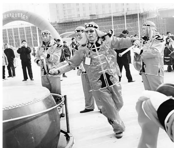
□臧德三 报道 11月9日，临沂市首届民间鼓友会举行，全市30余支锣鼓队4000余人共聚一堂，打擂切磋，以鼓会友。

萧平现任江苏省文化艺术研究院研究员、江苏省文史研究馆馆员、南京大学、东南大学、南京艺术学院、扬州大学兼职教授。此次展览展示的作品，山水、人物、花卉俱备，写意、工笔各尽其妙，清俊飘逸的楷书、行书，豪迈恣肆的隶书、草书各具风采。