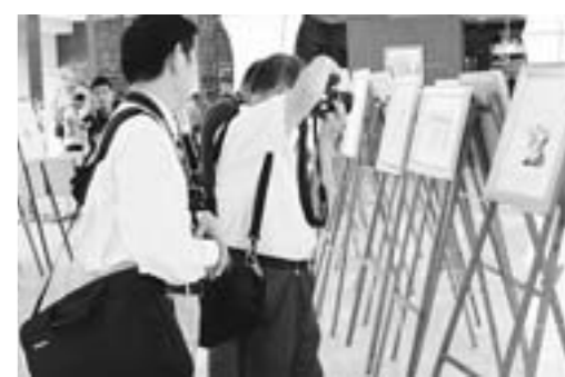
□王佳声 张强 报道

东平县自2009年起连续举办八届大型龙舟赛事活动,调动了群众参与龙舟运动的热情,打造了龙舟文化品牌。