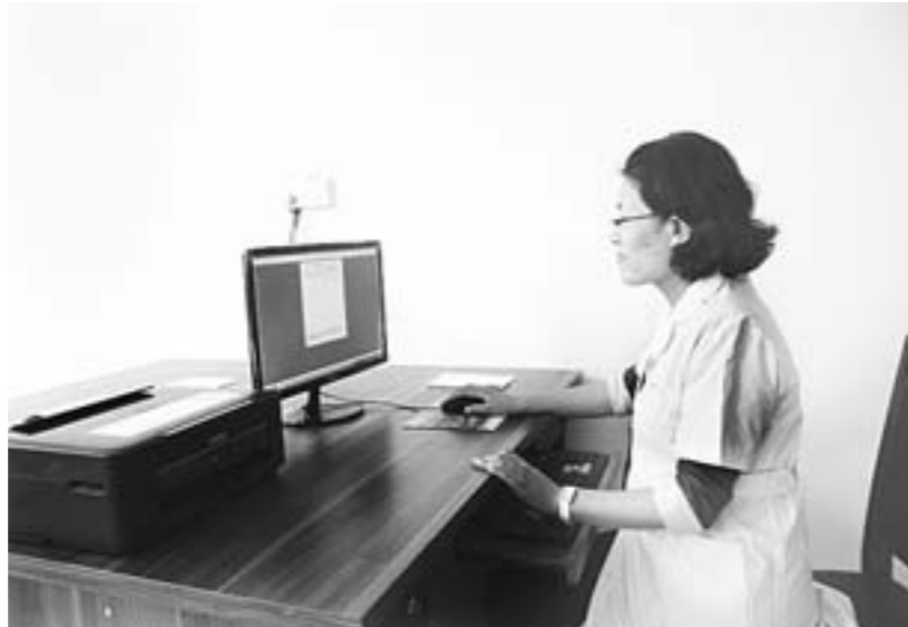
□王佳声 姜斌 报道 ▲利用远程审方系统,执业药师可同时为5家药店进行审方,缓解执业药师紧缺问题。

◆根据国家新版《药品经营质量管理规范》规定,每家药店需配备一名执业药师。但是泰安市仅有五分之一的单体药店配有执业药师,缺口很大。面对硬性规定,尚未配备执业药师的药店何去何从?