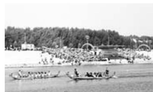
□王佳声 曹儒峰 报道

六星集团起步于台湾,成长于大陆,主营汽车产业园、工业园、IT制造、连锁汽车宾馆、互联网和文化地产。