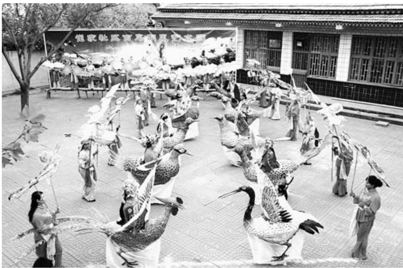
百鸟朝凤排练现场。