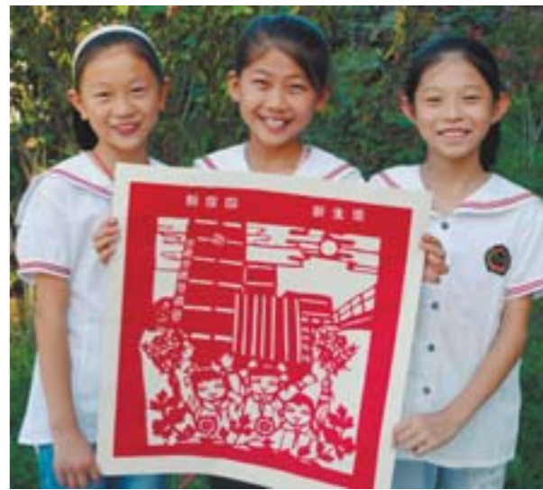
□卢鹏 林世军 报道

有家人团圆的喜悦，有儿女远方的思念，也有情人离别的惆怅……这样的中秋，月才会更圆，人才会更美。