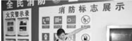
□刘晓明 李生涛 报道

□记者 郑颖雪 通讯员 薛丽 报道 本报诸城讯 近日记者从诸城市农业局获悉，诸城市中康农业有限公司入选100家国家农业科技创新与集成示范基地，成为潍坊市唯一一家入选的国家级农业科技创新与集成示范基地。