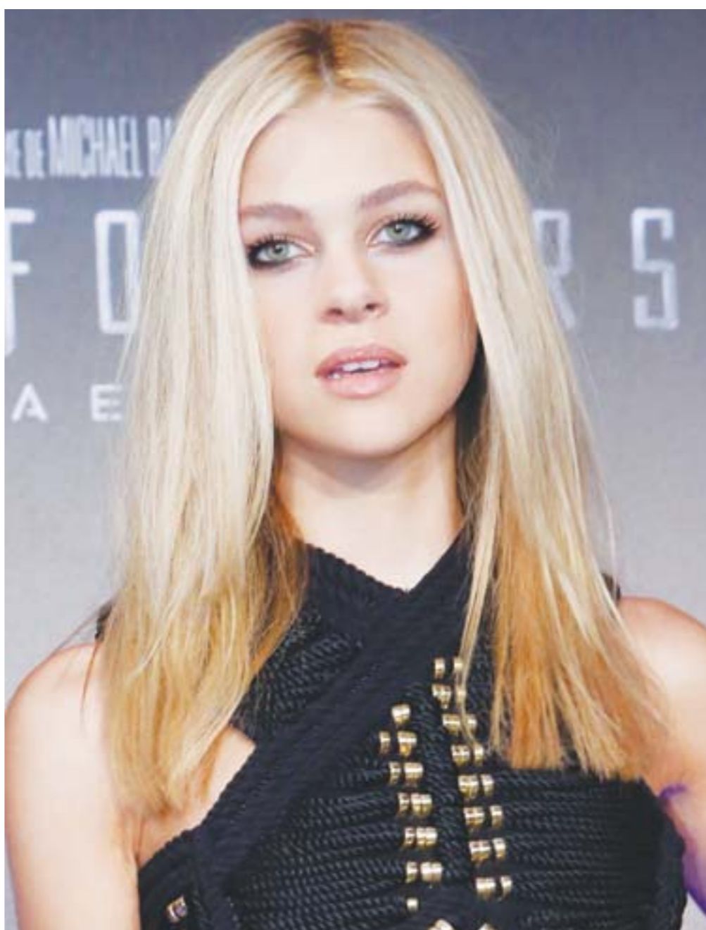
当地时间7月16日，女主角妮可拉·佩尔茨亮相《变形金刚4：绝迹重生》巴西首映礼。

当然，也有网友认为，对于拍摄地的宣传无可厚非，反而可以让观众更好地了解当地的风土人情。可对于某些户外真人秀节目拍摄造成的环境污染，网友则有些难以接受。近期，有网友曝光了《爸爸去哪儿》剧组离开呼伦贝尔草原时，留下了大量垃圾的照片，引发了一众网友的吐槽。尽管仅凭一张照片无法确定此事是否与《爸爸去哪儿》相关，制作方也没有对此进行回应，但网友的评论对制作方无疑是有促动作用的，希望《爸爸去哪儿》更注重言传身教，“爸爸去哪儿了？快回来把垃圾收拾了！”的呼声不要再起。