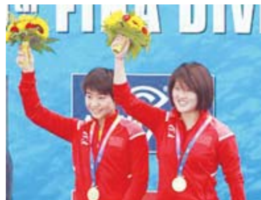
□新华社发 7月17日，陈若琳(右)和刘蕙瑕在领奖台上。当日，在2014年第十九届国际泳联跳水世界杯女子双人十米跳台决赛中，中国选手陈若琳/刘蕙瑕以总分357.66的成绩夺得冠军。