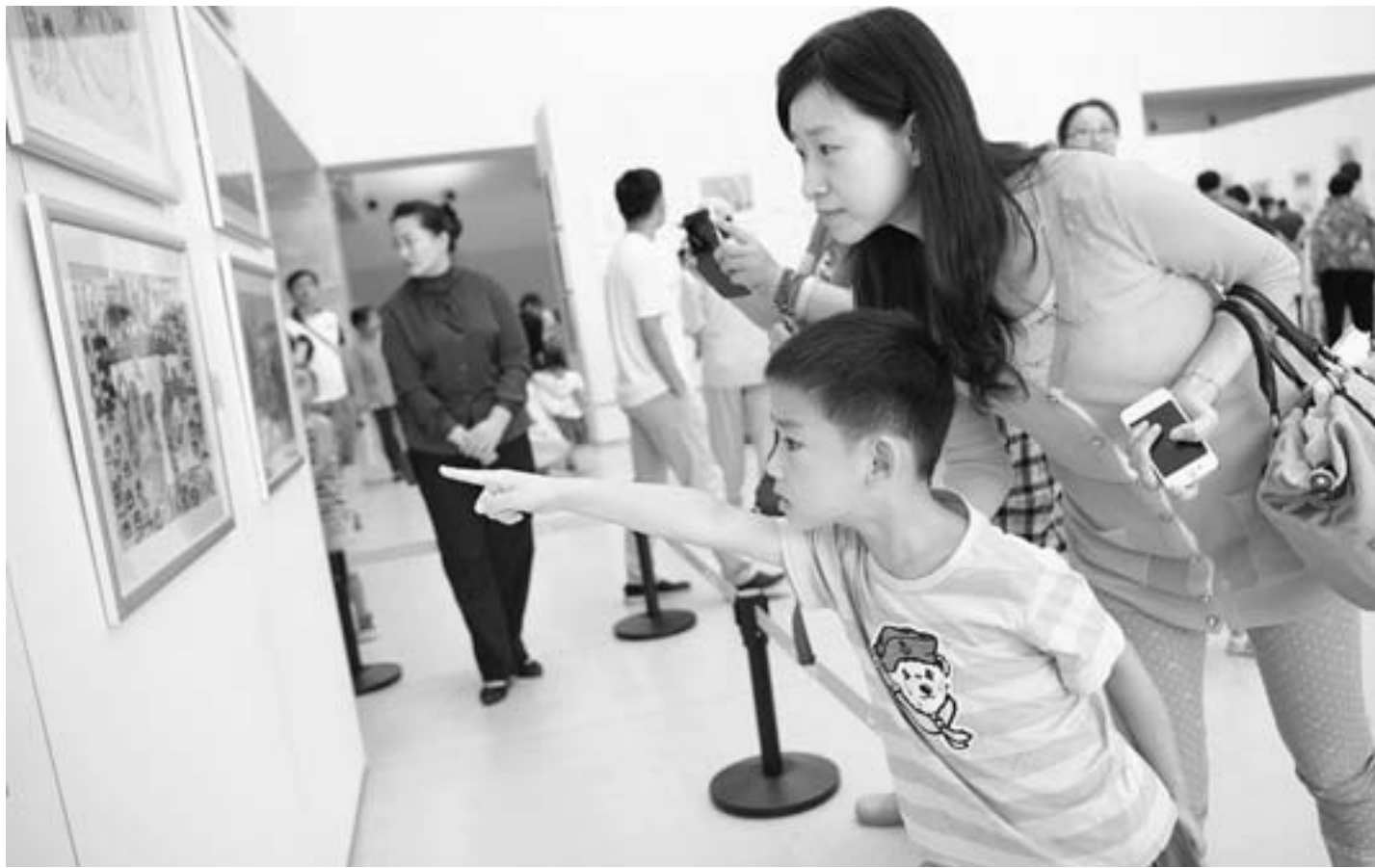
家长带着孩子在山东美术馆参观展览。