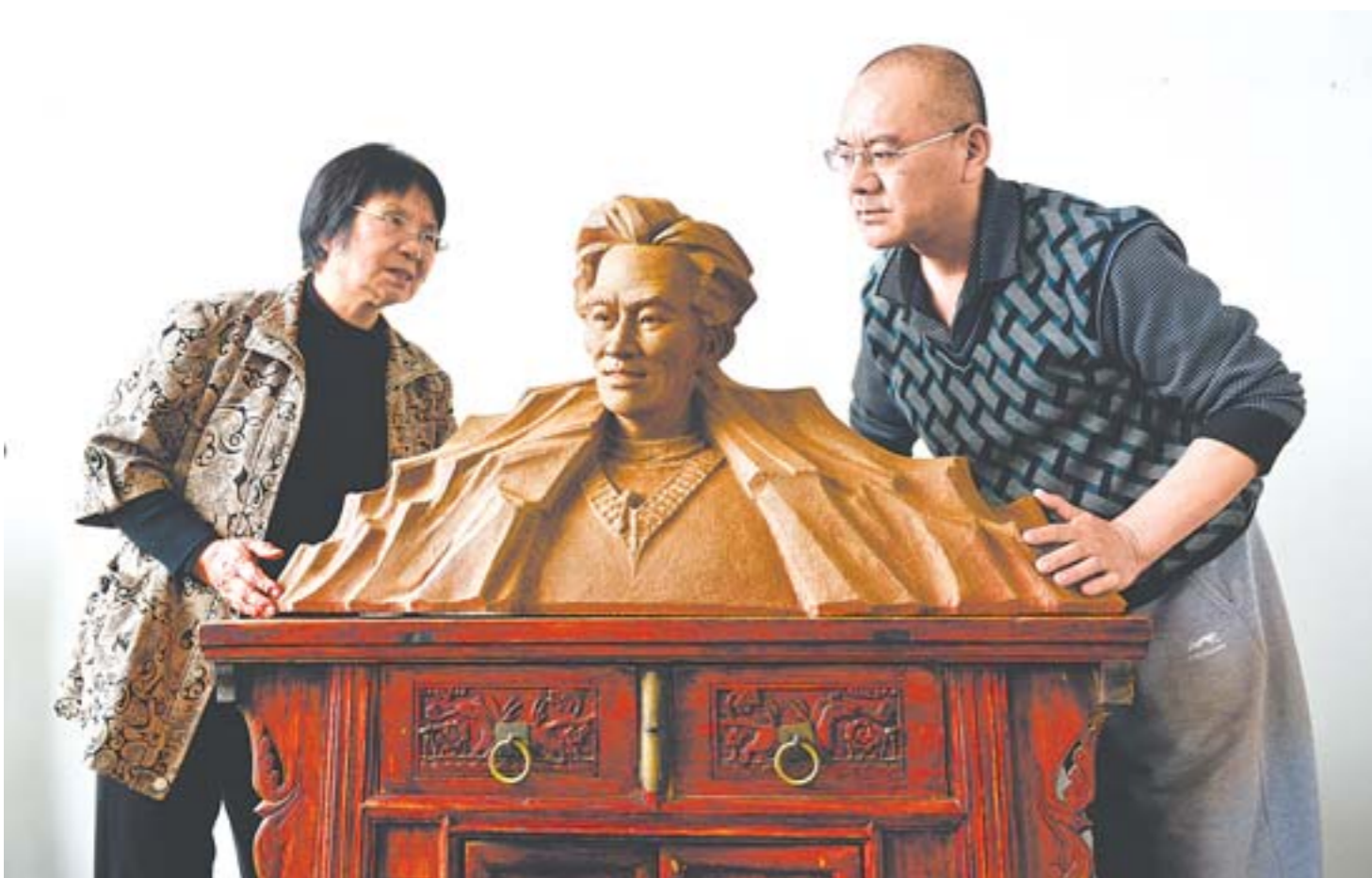
母子二人看着刚刚烧制出炉的作品爱不释手。