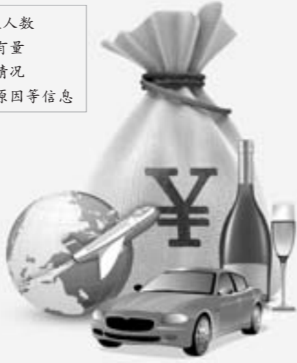
资料整理:魏然 制图:于海员

因公出国(境)团组数及人数 公务用车购置数及保有量 国内公务接待的有关情况 “三公”经费增减变化原因等信息