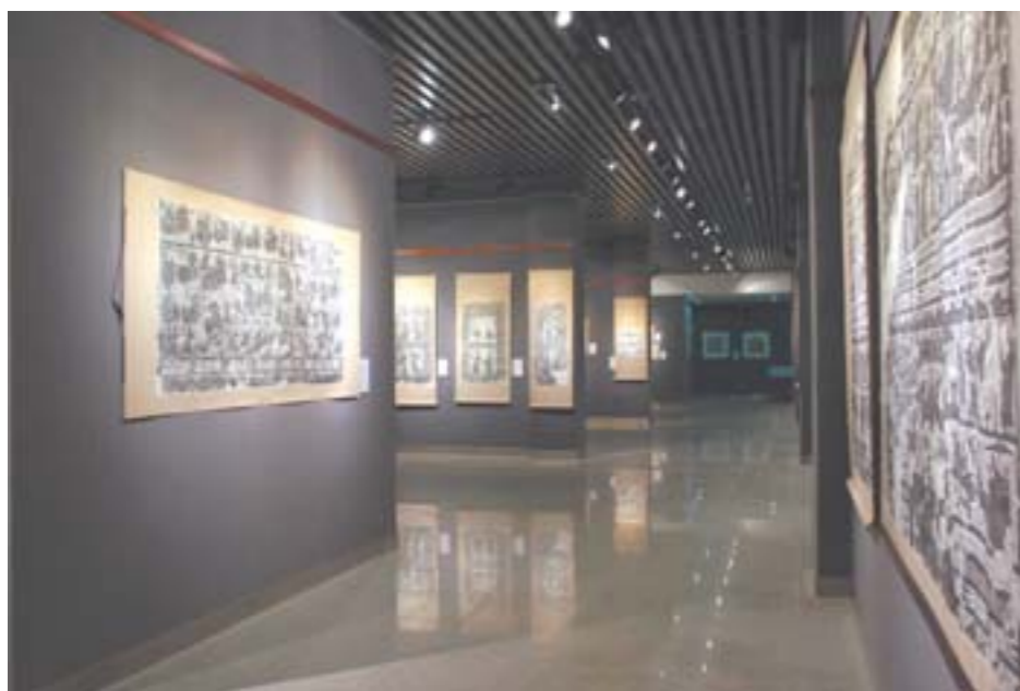
山东汉代画像石展厅一瞥。

□记者 于国鹏 通讯员 杨勇 报道 本报讯 由山东省石刻艺术博物馆和昆明市博物馆联合主办、云南油画协会和昆明碑林博物馆协办的《山东古代石刻拓片展》，日前在昆明市博物馆展出一个月。这次展览展示了山东古代石刻艺术的精华，受到当地学者、画家和市民的强烈关注。