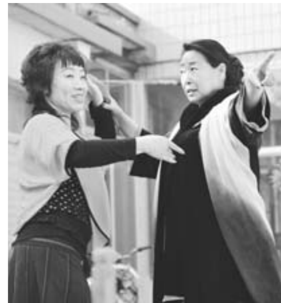
5月7日,邹平县柳家村村民在老师的指导下学习吕剧。对于热爱吕剧表演的群众,该县定期邀请专家传授表演技巧,弘扬吕剧艺术。