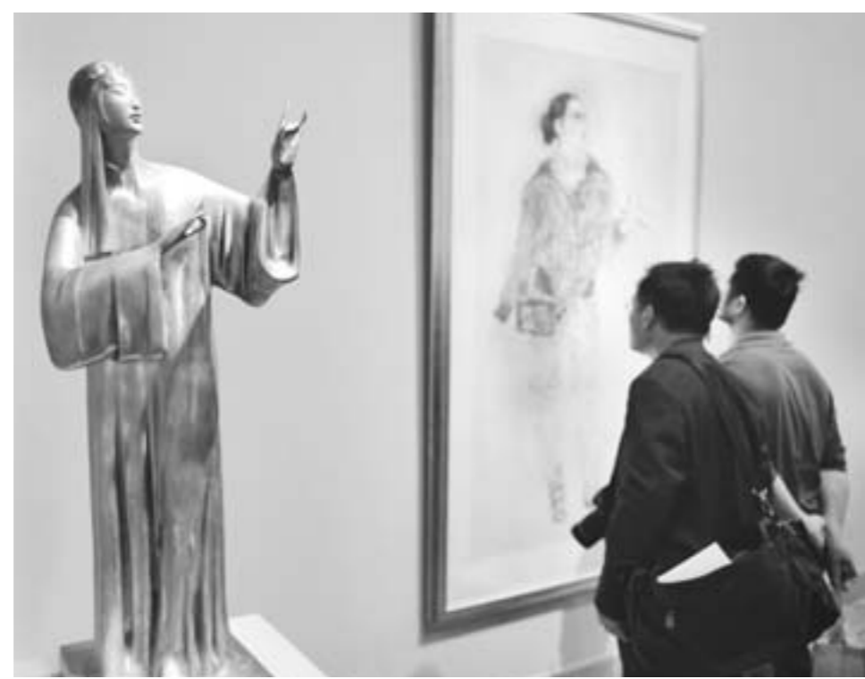
5月7日,“中国意象——当代中国水墨与雕塑艺术展”在北京中国美术馆开幕,以“中国意象”为题向公众展示富有东方意蕴的中国水墨画和雕塑艺术创作风貌。

□尹小燕 报道 本报临朐讯 近年来,临朐县第二实验小学加强学校文化建设,“行方思圆,一个都不能少”的文化宗旨深入人心,文化气息弥漫校园的每个角落,引领学校特色发展。 临朐第二实验小学通过开展“我为同事找优点”、“像关心自己的孩子一样关心每一名学生”等主题实践活动,培育教师良好的职业情感;以“星级学生”评选为主线,打造德育活动升级版。学校经过近几年的探索与打磨,逐步形成“方”、“圆”相融,相得益彰的“方圆育人”理念,即以“方”、“圆”为主线,以写字、乒乓球为龙头的两大类校本课程体系。以“方”为主线的课程包括写字育人课程、习惯养成课程等,以“圆”为主线的课程包括乒乓球运动育人课程、探寻石之前课程、科技创新课程等,挖掘本地文化和科技前沿文化,突出学校的文化个性,让课堂成为文化建设主阵地。