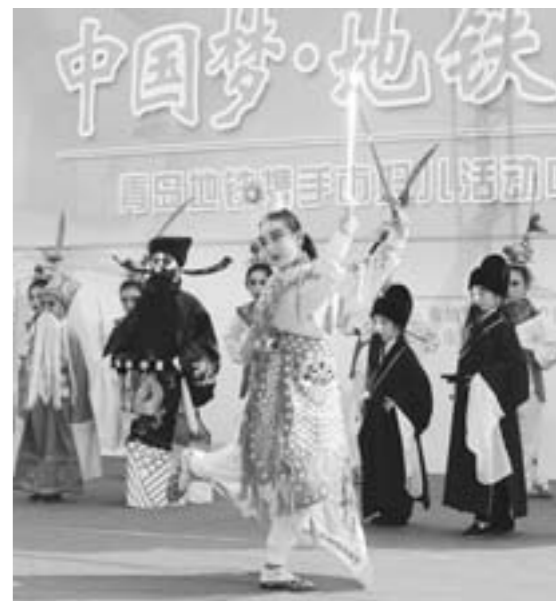
日前,青岛地铁指挥部与青岛市妇女儿童活动中心组织专人到青岛地铁3号线火车站施工现场,开展文艺演出,为地铁建设一线的劳动者表演了器乐演奏、京剧、诗歌朗诵等节目。

当代美术家,得天独厚地生逢一个中国文化大发展大繁荣、走向世界的新时代。你,准备如何去创作,去拥抱这个时代? (作者系山东大学教授)