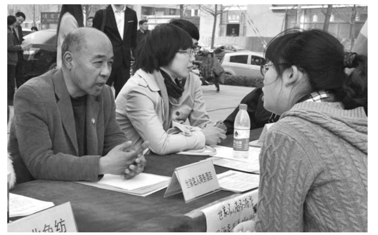
3月30日，奎文区2014年“春风行动”促进就业公益招聘会举行。共组织86家企业参加，发放招聘信息10000余份，1000余名求职者参加招聘，现场达成意向100余人。

同时，通过4条路径开展联建帮扶，共享理念及设施，打破学段之间壁垒，加强交流与合作。建立完善运动场地及设施设备共享制度，探索实施运动场地、微机室、实验室、图书室等资源联建校内共享；进行资金支持，城区学校每年资助镇街学校部分资金，用于改善办学条件、奖励品学兼优学生、救助生活困难师生等；开展物资帮助，城区学校及时将课桌、凳子、微机、实验器材、音像器材等捐助给镇街学校使用；加大智力支持，城区学校定期选派教育干部、骨干教师到镇街学校，通过讲座、报告会、学术沙龙、带徒、开发学校课程等方式，传授先进的教育理念、教学方法。