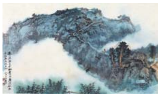
张大千 寻山深浅 国画 45cm×75cm 1981年