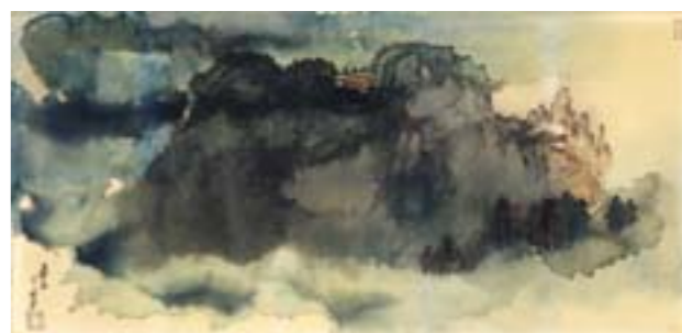
张大千 山寺 国画 43.5cm×90.5cm 1974年