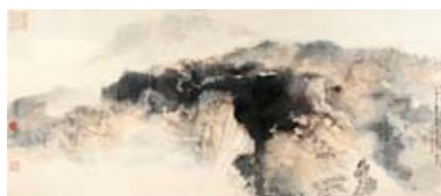
张大千 湖山隐居 国画 77.5cm×185cm 1978年