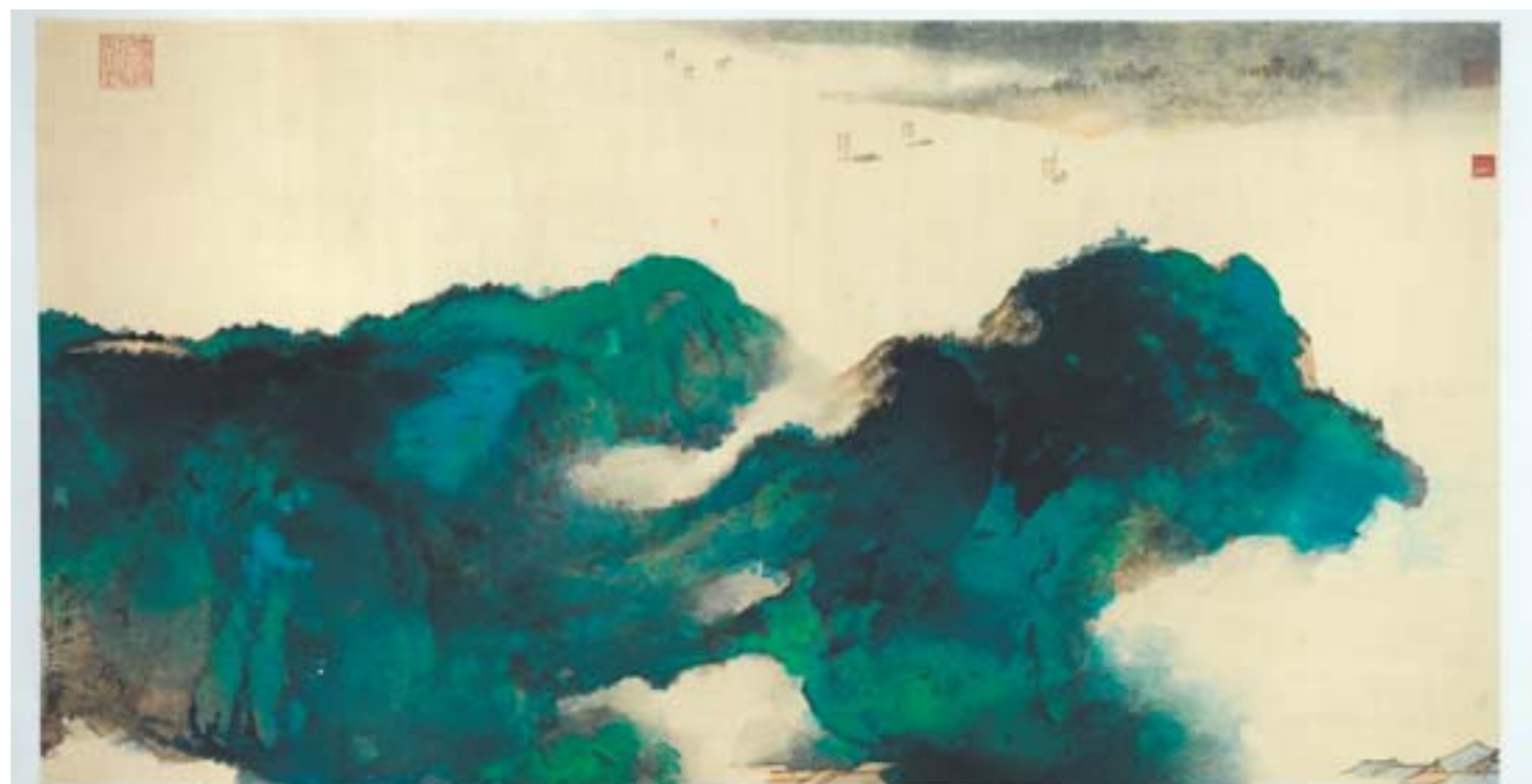
张大千 阔浦逢山 国画 102cm×193cm 1977年