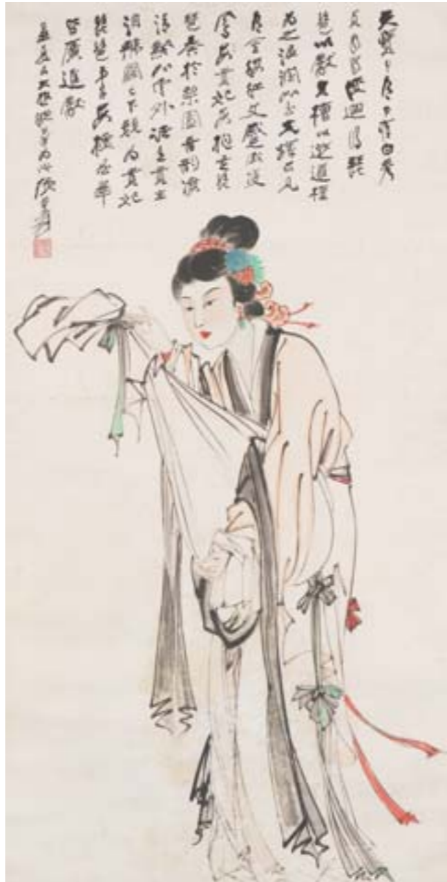
张大千 贵妃 国画 154.6cm×73.5cm 1949年