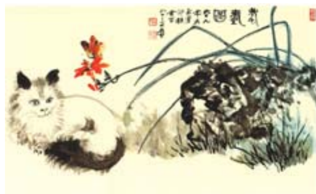
张大千 老猫图 国画 48.6cm×93cm 1980年