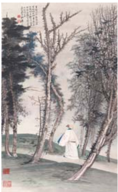
张大千 青城道上 国画 90.5cm×45.5cm 1939年

大千山水更是一绝。他笔下的山水，有时是诗，有时是小品文，有时是洋洋洒洒的长篇大论，无不理路清晰，意境空阔，灵气回荡。中年之后，他的绘画思想又有创新，在技法上则活用了古代的“泼墨”，更大胆尝试“泼色”，其作品兼具雄壮、秀丽之神韵。