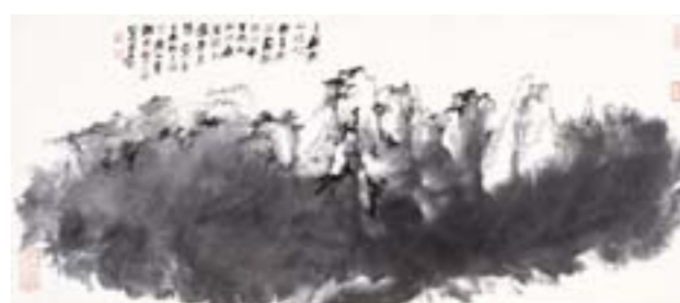
张大千 黄山 国画35cm×89cm 1979年