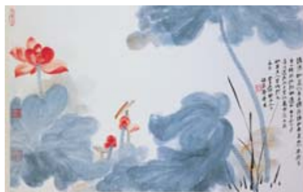
张大千 朱荷 国画 65cm×104.2cm 1973年