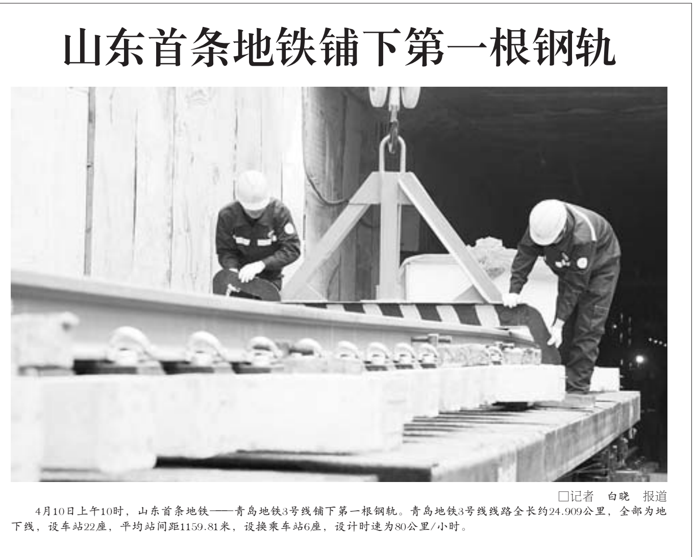
4月10日上午10时，山东首条地铁——青岛地铁3号线铺下第一根钢轨。青岛地铁3号线线路全长约24.909公里，全部为地下线，设车站22座，平均站间距1159.81米，设换乘车站6座，设计时速为80公里/小时。

在我省实施“第一书记”活动两周年之际，《第一书记·托起农民心中的中国梦》大型图片展4月9日在山东博物馆开幕，展出共六大部分、160张精彩照片，生动反映了“第一书记”在基层的工作和生活状况。从2012年4月开始，借助中央部署开展“基层组织建设和创先争优”的契机，我省选派2.6万名“第一书记”，深入1.8万个基层单位抓党建促脱贫，上千名省直党员干部来到中西部528个贫困村进行帮扶。(□李占江 报道)