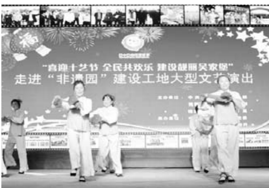
△走进“非遗园”建设工地文艺演出