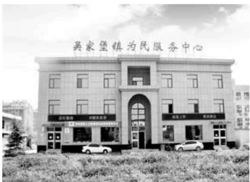
△惠民工程——为民服务中心