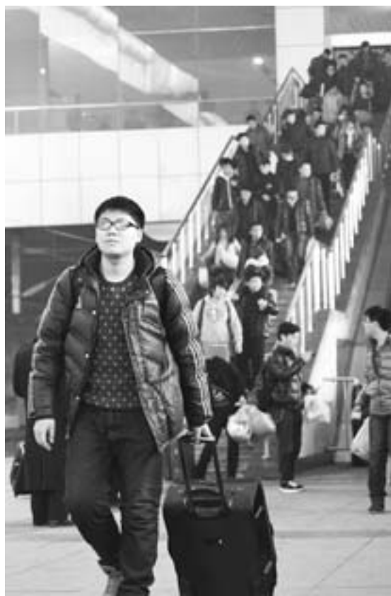
1月16日，济南火车站客流量平稳、乘车有序。 □记者 王世翔 报道