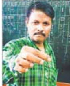
印度警察逼抢匪吃香蕉 排出11克重金属链

在韩国首尔，越南航空飞机上突然举行了一场比基尼选美比赛，让乘客们在冬日眼前一亮。