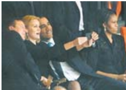
奥巴马玩“自拍” 米歇尔怒吼

美国一八卦刊物爆出：在曼德拉追思会上，奥巴马与丹麦女首相赫勒·托宁·施密特玩“自拍”，米歇尔看到这一幕，怒吼：“我受够了！”内幕人士称，目前奥巴马夫妇已经分居。