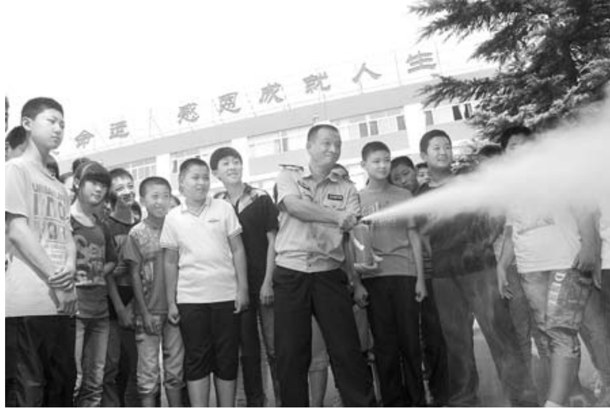
宋学宝 张良 报道 9月2日，青州市瓜市派出所民警应邀为辖区内职工子弟中学的学生们上了一堂消防安全课。当日是青州市各中小学校新学期开学第一天，该市各学校开展了“民警叔叔进课堂”等多种形式的安全教育活动，进一步强化学生安全意识。

截至目前，网站共发布各类信息超过14万余，网站注册用户突破5.9万人，发表各类博客日志、论坛帖子等10万余篇，在潍坊市教育网站综合流量排名中名列前茅。