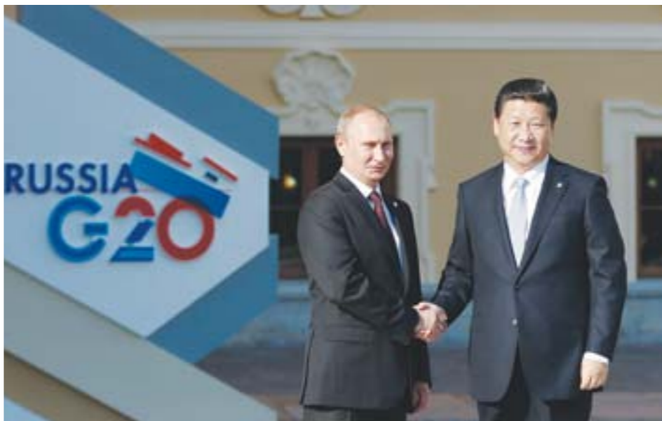
峰会开始前，习近平抵达圣彼得堡康斯坦丁宫，受到普京迎接。

主要经济体要首先办好自己事，确保自己的经济不出大的乱子。各国加强宏观经济政策沟通和协调。中国采取的经济政策既对中国负责，也对世界经济负责。中国经济基本面良好，我们坚定推动结构性改革，宁可增长速度降下来一些。中国有条件有能力实现经济持续健康发展，为世界经济带来更多正面外溢效应。