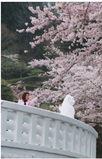
四月八九重樱,花开锦绣最繁盛。轻盈雅洁犹高贵,仪态纤柔著温情。不宜雨中似云湿,悦其风中雪来倾。浪漫异国几町醉,笑他春心一时惊。 ——槐月,赴日本樱花之旅有感

总觉得,樱花之美,红于陌上,开在山涧,傍在层崖上,安妥在精致的木屋庭院前,最为相宜。如若碰到有风的日子,花从碧空漫落,须臾间,雨花霏霏,一地壮观的落红是满眼的诗情画境。