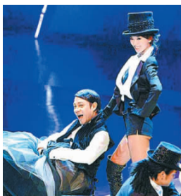
上一次，志玲姐姐和康永哥搭档，一转眼已是11年前的事了