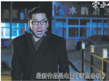
最新作品是电影《零点杀机》