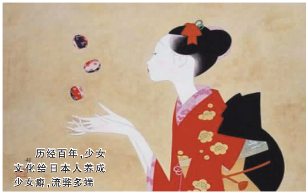
历经百年,少女文化给日本人养成少女癖,流弊多端

中产阶级家庭不仅供女儿上学,而且给她们购买少女杂志。单女学生算不上少女,少女的形象还须由少女杂志塑造。明治35年(1902年)《少女界》创刊,成为日本第一本少女杂志,随后《少女世界》、《少女之友》、《少女画报》、《少女俱乐部》等相继问世。少女杂志的内容以小说为主,大都是以高等女学校的学生为主人公。女学生们聚集在学校这个空间里,交流读少女杂志的心得,并且给杂志写信或投稿,寻求认同,编织少女梦。说到底,少女